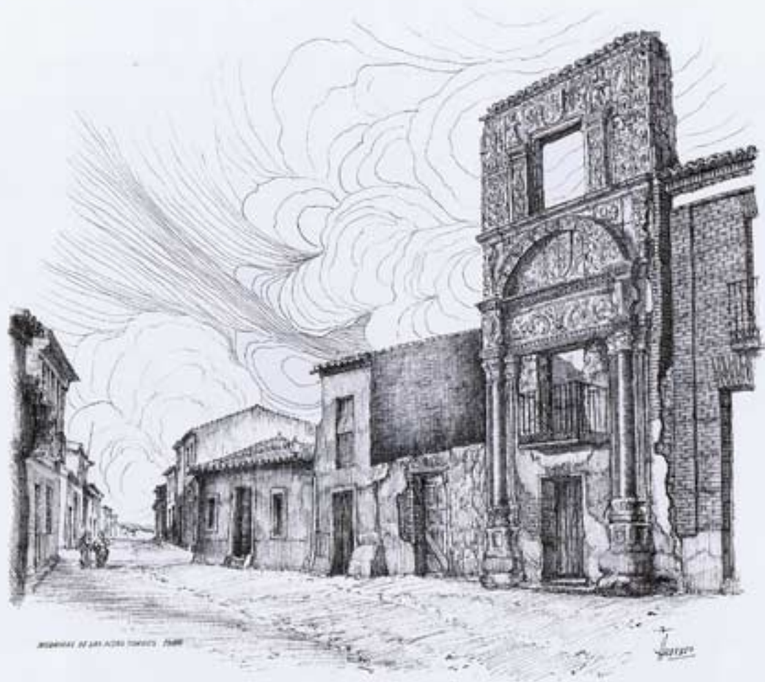
Highway at San Juan, 1890