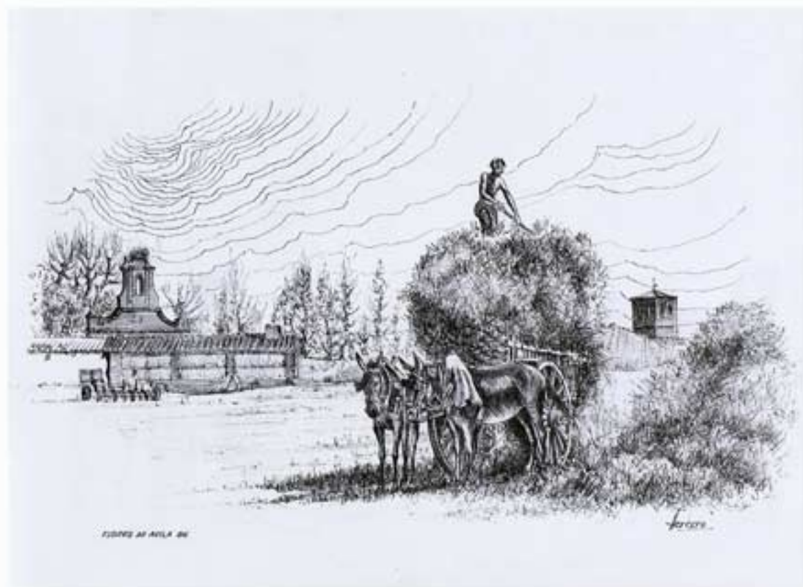
FIGURA AN ANGLA 86